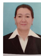
ДжГПИ старшие преподаватели